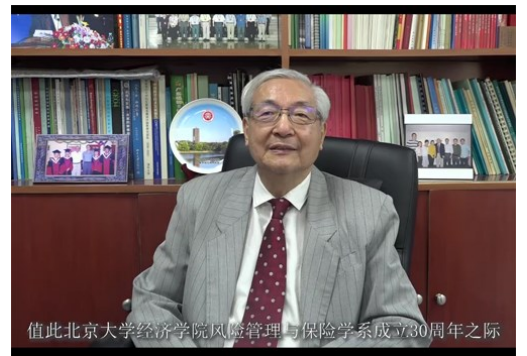
值此北京大学经济学院风险管理与保险学系成立30周年之际

北京大学原校长许智宏院士发表了视频致辞。许校长对风保系成立三十周年向各位老师、同学和校友致以祝贺，他说很高兴见证了北大风保系的早期成长，也见证了孙祁祥教授、郑伟教授和老师同学们为风保系发展付出的艰辛努力和取得的优异成绩。许校长表示，希望北大风保系全体师生继续坚守专业梦想，不忘初心，为北大建设世界一流大学贡献出更大的力量！