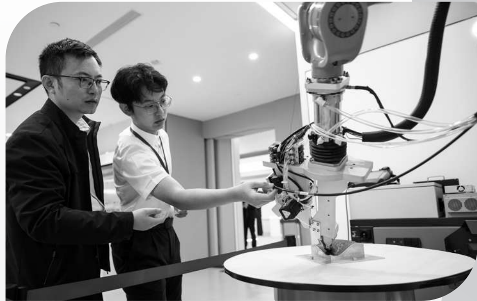
有“中国光谷”之称的武汉东湖新技术开发区,是以“光”命名的国家自主创新示范区,不断推动科技创新和产业创新深度融合。在武汉产业创新发展研究院,工作人员展示增材制造机器人。