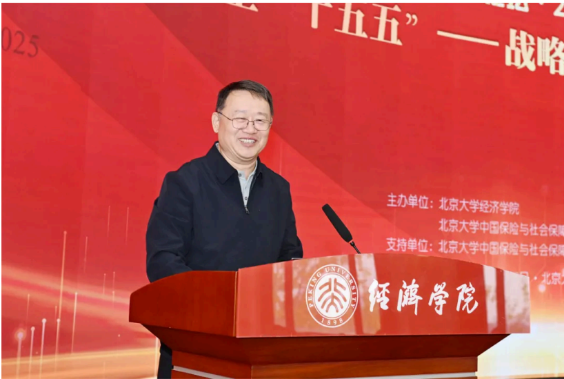
梁涛发表大会演讲

原中国银保监会副主席梁涛以“坚持高质量发展，提升保险与经济的适配性”为题，阐述了对于保险业未来发展的建议。他谈到，“十五五”时期经济社会高质量发展对保险业提出了更高要求，应从三个方面提升保险业与经济发展的适配性。第一，高效服务现代化产业体系建设和新质生产力发展。应大力发展科技相关保险，运用保险资金服务新质生产力，大力发展绿色保险，以及数据资产和网络安全保险。第二，有力支持构建新发展格局。应发展国内信用保险、国际运输和航运保险。第三，有效满足民生领域金融需求。应发展养老健康保险，提高普惠保险服务的可及性和标准，大力发展农业保险和灾害保险。