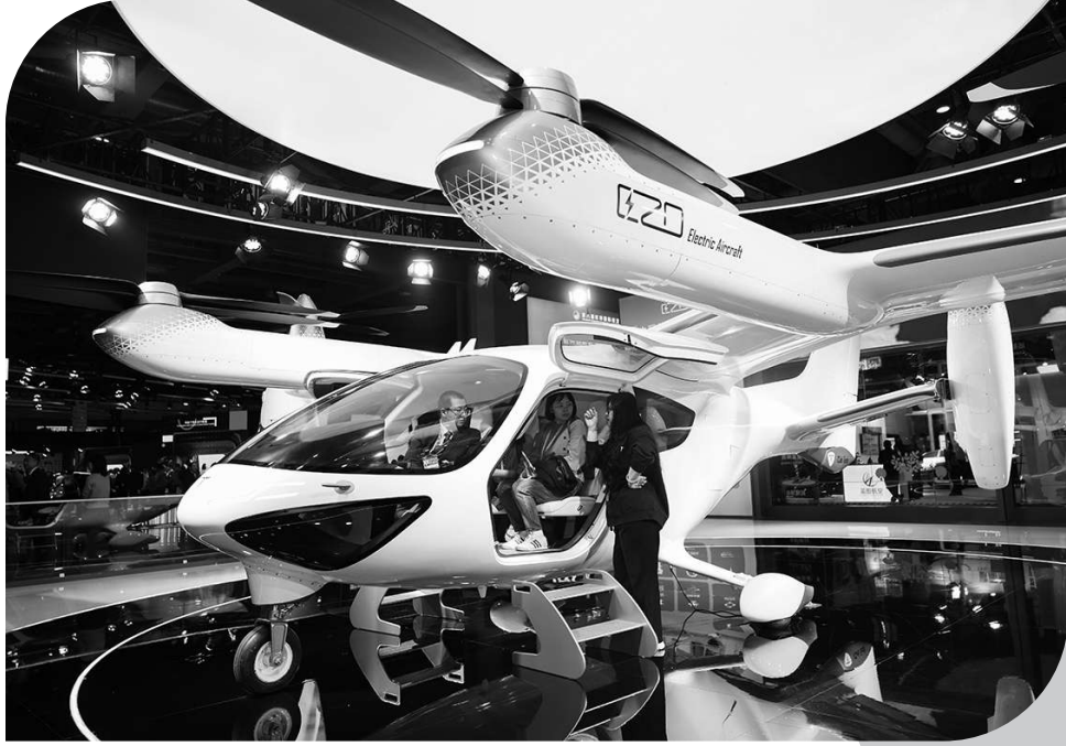
图为11月8日,人们在第八届进博会汽车及智慧出行展区时的科技展位体验电动垂直起降飞行器。

周延礼认为,首先,应强化数据整合与标准化能力,汇聚多方数据构建完整性基础,通过技术处理实现信息提取与标准化,搭建客户数据平台;提升专业能力,实时检测、识别并处理错误、缺失及重复性数据质量问题。其次,构建数据治理闭环,兼顾存量数据与新增数据,关注市场预测数据关联,实现数据自动化上报,提升数据准确性与完整性;同步加强网络安全维护。最后,筑牢数据安全防线,运用多种技术手段保障数据安全,超前布局