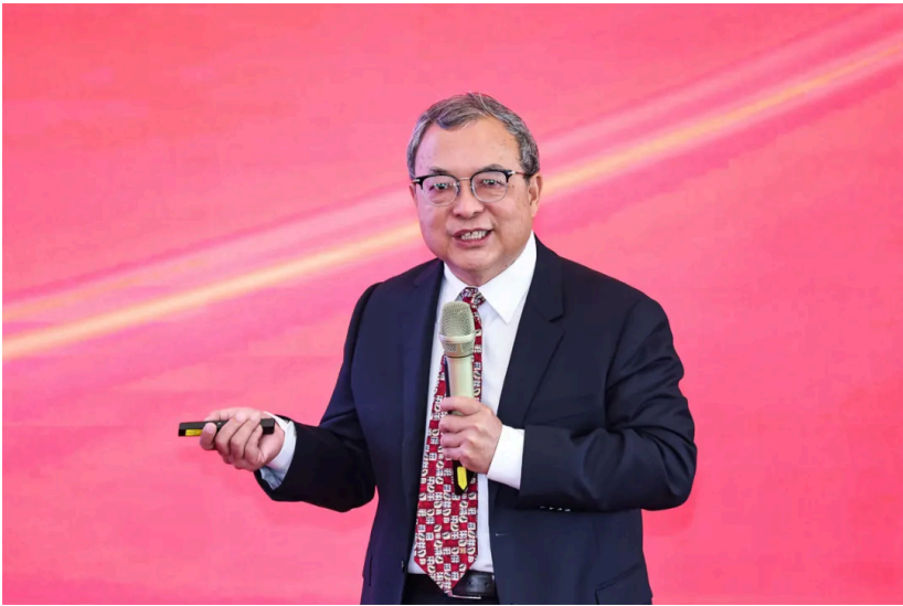
陈文辉发表大会演讲

国家医疗保障局原副局长陈金甫以“‘十五五’医保发展挑战与改革：系统性冲突与破局”为题，阐述了医保发展面临的挑战与突破方向。他指出，进入“十五五”时期，医保体系面临多重命题与挑战。在共同富裕目标下，医疗资源分布不均制约收入均等化进程；高质量发展要求加快建成多层次医疗保障体系；科技立国战略要求三医实现协同治理与创新。医保改革需从多维度寻求突破。一是以系统统筹破解制度壁垒与基金瓶颈，并通过三医协同深化战略性购买，提升整体运行效能；二是从国家战略层面加快发展商业健康保险，促进社会保险与商业保险深度融合，构建多层次医疗保障体系；三是以机制协同破解医药科技创新困局，充分发挥医保支付与医药价格机制对医药科技创新的杠杆作用，为行业发展注入新动能。