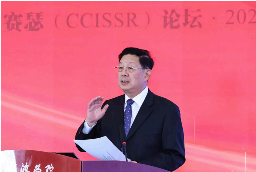
胡晓义发表大会演讲

中国保险学会会长董波以“保险业奋力谱写高质量发展新篇章”为题发表演讲。他首先回顾了“十四五”期间，保险业在服务国家战略、保障民生福祉、防灾减灾救灾和科技赋能转型等方面取得的显著成效。在民生领域，保险业不断完善农业保险、养老保险与健康保险体系，聚焦城乡居民多层次保障需求。在绿色与科技领域，保险业不断推进产品创新与数字化转型。在防灾减灾救灾方面，保险业充分发挥经济“减震器”和社会“稳定器”功能。展望“十五五”，保险业将继续以高质量发展为主线，更好服务国家战略，守护人民美好生活。