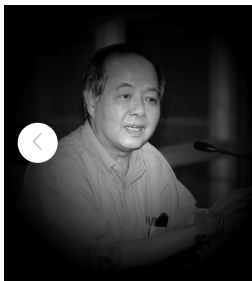
深切缅怀李政道先生