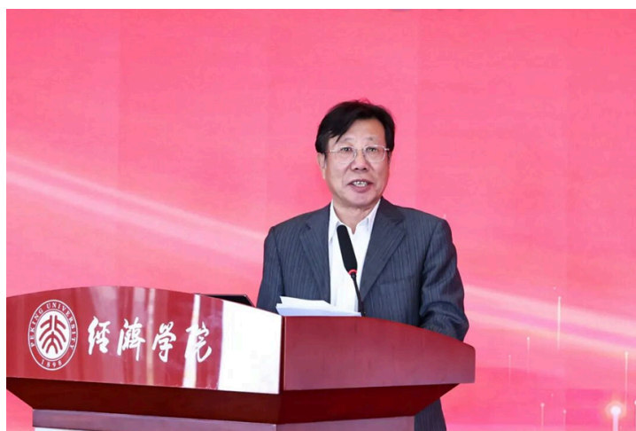
(董波发表大会演讲)

中国保险学会会长董波以“保险业奋力谱写高质量发展新篇章”为题发表演讲。他首先回顾了“十四五”期间保险业在服务国家战略、保障民生福祉、防灾减灾救灾和科技赋能转型等方面取得的显著成效，并且指出，在民生领域，保险业不断完善农业保险、养老保险与健康保险体系，聚焦城乡居民多层次保障需求;在绿色与科技领域，保险业不断推进产品创新与数字化转型;在防灾减灾救灾方面，保险业充分发挥经济“减震器”和社会“稳定器”功能。他强调，展望“十五五”，保险业将继续以高质量发展为主线，更好服务国家战略，守护人民美好生活。