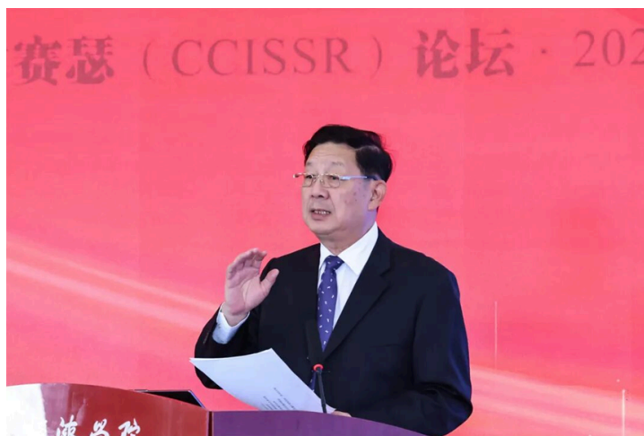
(胡晓义发表大会演讲)

中国保险学会会长董波以“保险业奋力谱写高质量发展新篇章”为题发表演讲。他首先回顾了“十四五”期间保险业在服务国家战略、保障民生福祉、防灾减灾救灾和科技赋能转型等方面取得的显著成效，并且指出，在民生领域，保险业不断完善农业保险、养老保险与健康保险体系，聚焦城乡居民多层次保障需求;在绿色与科技领域，保险业不断推进产品创新与数字化转型;在防灾减灾救灾方面，保险业充分发挥经济“减震器”和社会“稳定器”功能。他强调，展望“十五五”，保险业将继续以高质量发展为主线，更好服务国家战略，守护人民美好生活。