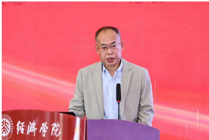
(陈金甫发表大会演讲)

国家医疗保障局原副局长陈金甫以“‘十五五’医保发展挑战与改革：系统性冲突与破局”为题，阐述了医保发展面临的挑战与突破方向。他指出，进入“十五五”时期，医保体系面临多重命题与挑战。在共同富裕目标下，医疗资源分布不均制约收入均等化进程；高质量发展要求加快建成多层次医疗保障体系；科技立国战略要求“三医”实现协同治理与创新。因此，他提出，医保改革需从多维度寻求突破：一是以系统统筹破解制度壁垒与基金瓶颈，并通过“三医”协同深化战略性购买，提升整体运行效能；二是从国家战略层面加快发展商业健康保险，促进社会保险与商业保险深度融合，构建多层次医疗保障体系；三是以机制协同破解医药科技创新困局，充分发挥医保支付与医药价格机制对医药科技创新的杠杆作用，为行业发展注入新动能。