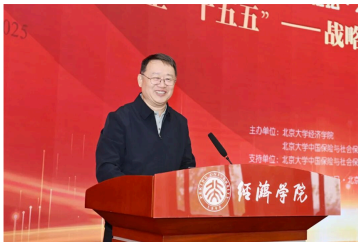
(梁涛发表大会演讲)

在大会演讲阶段,原中国银保监会副主席梁涛以“坚持高质量发展,提升保险与经济的适配性”为题,阐述了对于保险业未来发展的建议。他谈到,“十五五”时期经济社会高质量发展对保险业提出了更高要求,应从三个方面提升保险业与经济发展的适配性。第一,高效服务现代化产业体系建设和新质生产力发展。应大力发展科技相关保险,运用保险资金服务新质生产力,大力发展绿色保险,以及数据资产和网络安全保险。第二,有力支持构建新发展格局。应发展国内信用保险、国际运输和航运保险。第三,有效满足民生领域金融需求。应发展养老健康保险,提高普惠保险服务的可及性和标准,大力发展农业保险和灾害保险。