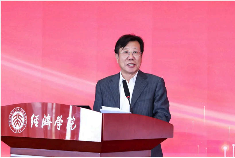
董波发表大会演讲

中国保险学会会长董波以“保险业奋力谱写高质量发展新篇章”为题发表演讲。他首先回顾了“十四五”期间，保险业在服务国家战略、保障民生福祉、防灾减灾救灾和科技赋能转型等方面取得的显著成效。在民生领域，保险业不断完善农业保险、养老保险与健康保险体系，聚焦城乡居民多层次保障需求。在绿色与科技领域，保险业不断推进产品创新与数字化转型。在防灾减灾救灾方面，保险业充分发挥经济“减震器”和社会“稳定器”功能。展望“十五五”，保险业将继续以高质量发展为主线，更好服务国家战略，守护人民美好生活。