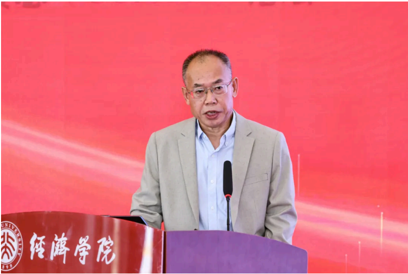
陈金甫发表大会演讲

国家医疗保障局原副局长陈金甫以“‘十五五’医保发展挑战与改革：系统性冲突与破局”为题，阐述了医保发展面临的挑战与突破方向。他指出，进入“十五五”时期，医保体系面临多重命题与挑战。在共同富裕目标下，医疗资源分布不均制约收入均等化进程；高质量发展要求加快建成多层次医疗保障体系；科技立国战略要求三医实现协同治理与创新。医保改革需从多维度寻求突破。一是以系统统筹破解制度壁垒与基金瓶颈，并通过三医协同深化战略性购买，提升整体运行效能；二是从国家战略层面加快发展商业健康保险，促进社会保险与商业保险深度融合，构建多层次医疗保障体系；三是以机制协同破解医药科技创新困局，充分发挥医保支付与医药价格机制对医药科技创新的杠杆作用，为行业发展注入新动能。