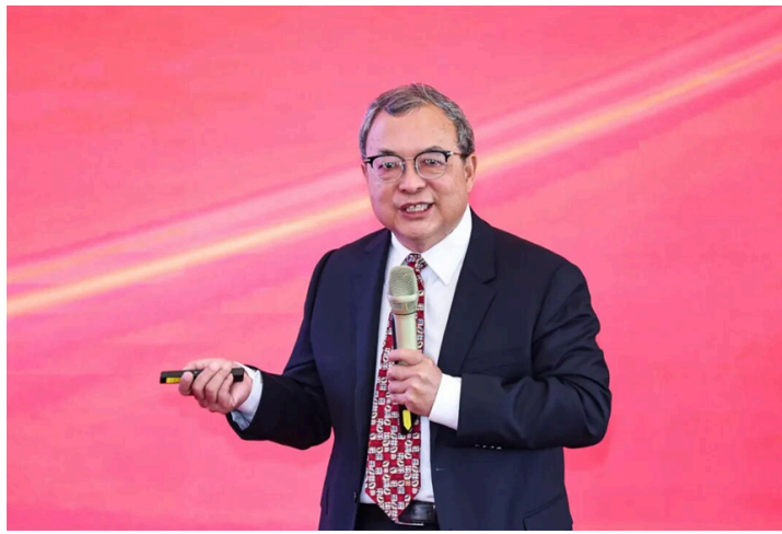
(陈文辉发表大会演讲)

国家医疗保障局原副局长陈金甫以“‘十五五’医保发展挑战与改革：系统性冲突与破局”为题，阐述了医保发展面临的挑战与突破方向。他指出，进入“十五五”时期，医保体系面临多重命题与挑战。在共同富裕目标下，医疗资源分布不均制约收入均等化进程；高质量发展要求加快建成多层次医疗保障体系；科技立国战略要求“三医”实现协同治理与创新。因此，他提出，医保改革需从多维度寻求突破：一是以系统统筹破解制度壁垒与基金瓶颈，并通过“三医”协同深化战略性购买，提升整体运行效能；二是从国家战略层面加快发展商业健康保险，促进社会保险与商业保险深度融合，构建多层次医疗保障体系；三是以机制协同破解医药科技创新困局，充分发挥医保支付与医药价格机制对医药科技创新的杠杆作用，为行业发展注入新动能。