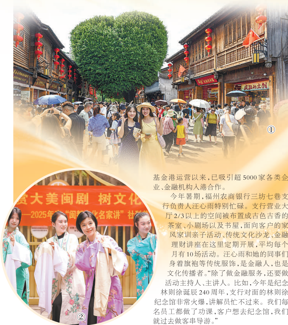
图①:今年暑期,在福州市三坊七巷的“网红”爱心树下,游客纷纷拍照打卡。

保财险福建分公司“古厝险”累计承保福州市共计88处不可移动文物,累计提供风险保障1.85亿元,为一大批文物建筑撑起“安全伞”。